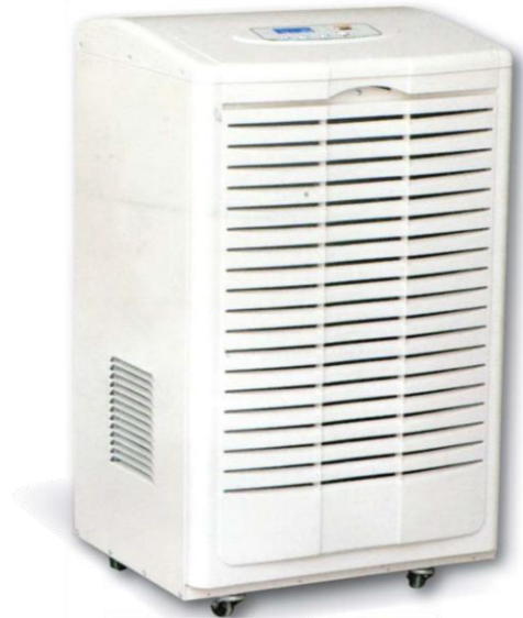
FDH-290BC / FDH-2108BC