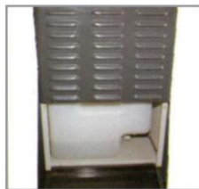
Built-in large water tank