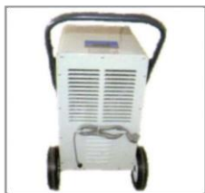
Behind the machine