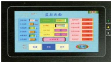
Touch screen controller