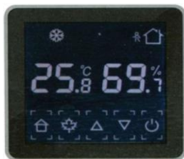
86 type standard box controller